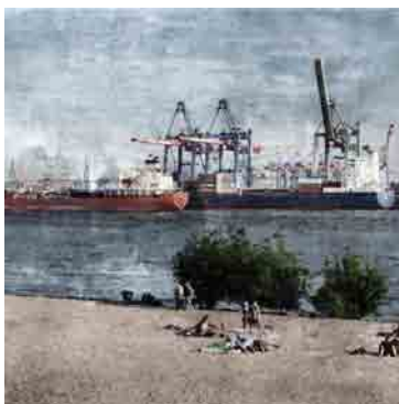
Composizioni digitalizzate ed acquerello