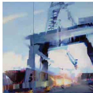
Cromatismo pittorico intriso d'intense sfumature