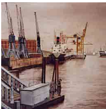
Acquaforte ed acquarelli tradizionali