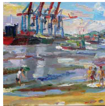
Intenso cromatismo d'ispirazione espressionista