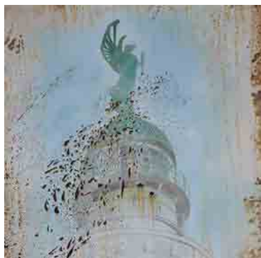
Pittura fotorealistica a olio