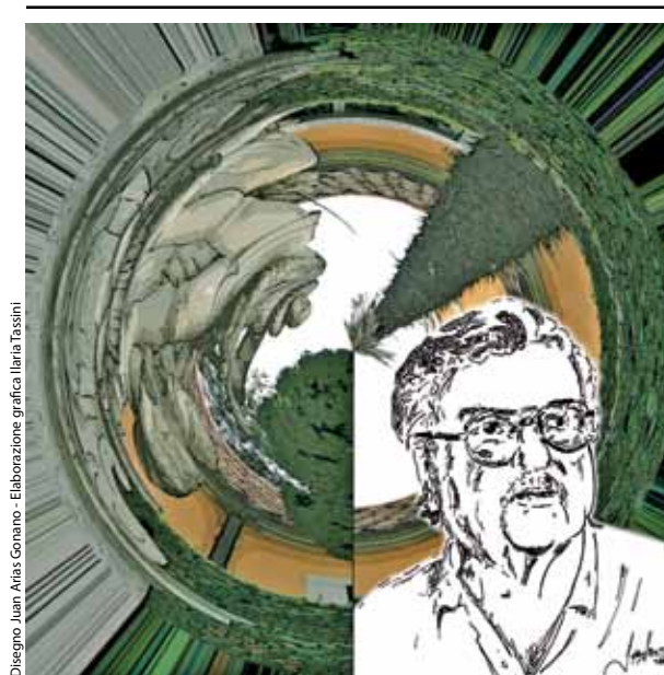
Disegno Juan Arias Gonano - Elaborazione grafica Ilaria Tassini