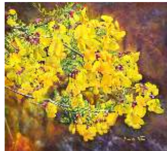
47 NALDI BRUNA - Bisbigli