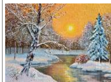
39 LUSSETTI PATRIZIA - Sogno d'inverno