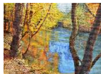
7 BELLETTINI ALICE - Riflessi autunnali