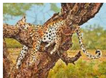
10 BILARDO GIOSUÈ - Siesta