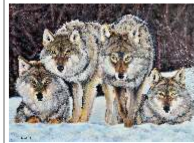
35 IURIN CLAUDIO - Branco di lupi