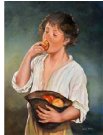
55 RIVA NEVA - Scugnizzo