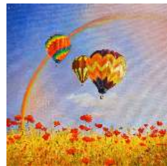
50 PITACCO GABRIELLA - Aria di festa