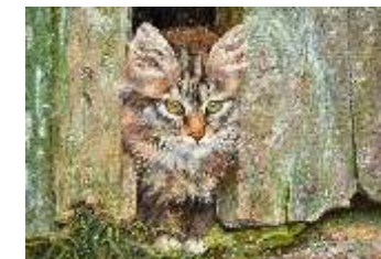
42 MARSICH NADA - Micio curioso