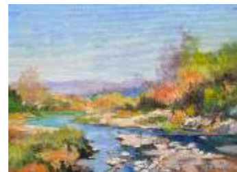
1 ALBRECHT GABRIO - Estate sul fiume

I pittori i cui nomi sono scritti in rosso hanno all'attivo mostre personali.