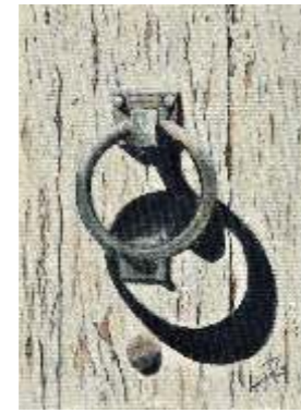
52 RABBAIOLI LAURA - Toc toc