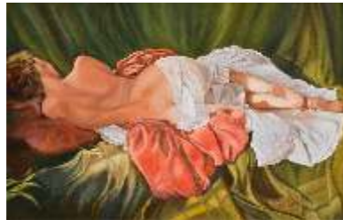
57 ROVATTI FULVIA - Sognando