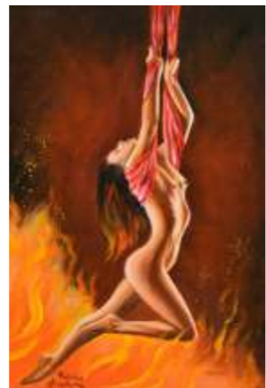
2 ANASTASIA FEDERICA Tendere Oltre