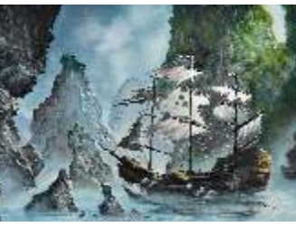
6 BELLETTI GABRIELLA - Rifugio