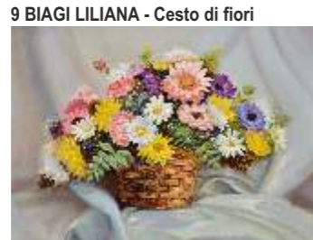
9 BIAGI LILIANA - Cesto di fiori