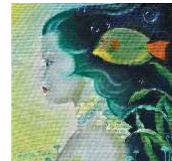
36 IUSTULIN ISABELLA - Sirenetta