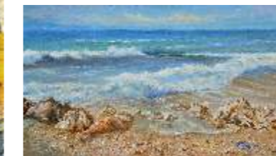
26 DEPASE GIUSEPPINA - Marina istriana