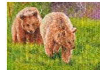
42 MARSICH NADA - Micio curioso