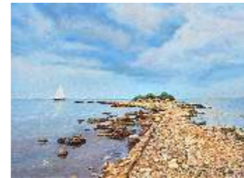
70 STUPER LUCA - Le rovine di Sipar