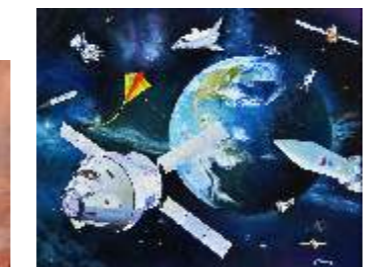
67 STAURINI CARLO Non c'è più "spazio"