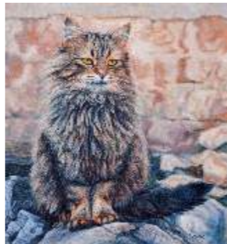
17 CENCIĆ TINA - Capocantiere