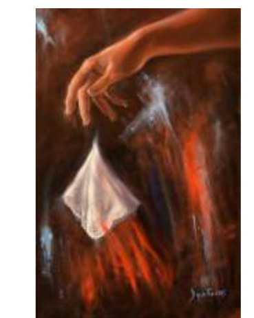
30 DIPIETRO GABRIELLA Desdemona