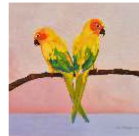
59 SALDANA OTILIA Inseparabili