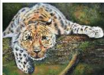
18 CIACCHI MICOL - L'agguato