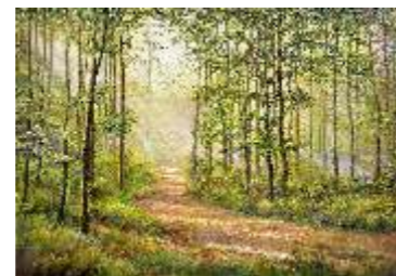
56 RIZZOLA MARIATERESA - Nel bosco