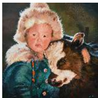
11 BON GIULIA - Piccolo Temujin