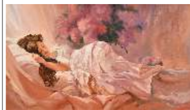
68 STOR ADRIANA La bella addormentata