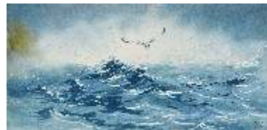
66 SOLDATICH LILI - Il gabbiano