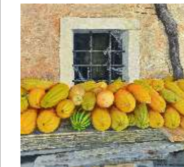
25 DEBIASI LILIA - Zucche