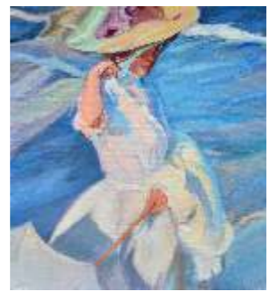
58 ROWDEN YVONNE Omaggio a Sorolla