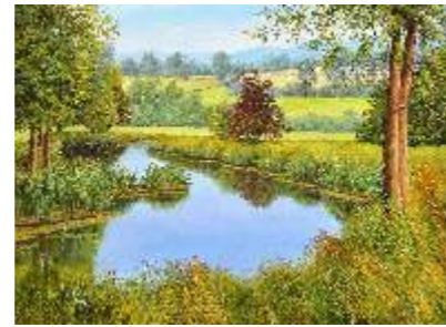
53 RAZZA GIUSEPPE - Sinfonia in verde