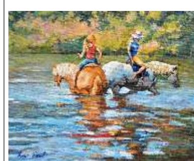
37 KOSOVEL KARIN - Al guado