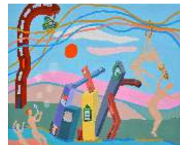
76 ZORS SERENA - Bolle di sapone