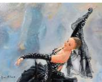
29 DI LULLO FRANCA - Ballerina