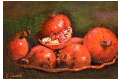
61 SALVANESCHI GIOIANA - Melagrani