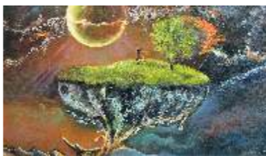
23 DAGOSTINI NORIS - Nowhere