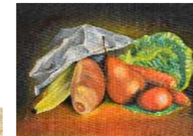
24 DASSI LARA - Il pane