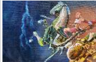
71 VERZA CHIARA - Lightning