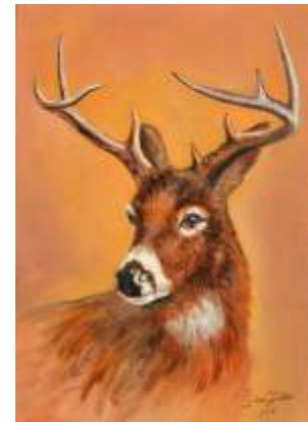
65 ŠIRCA GIUSEPPE - Il cervo