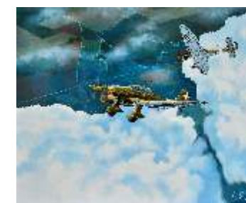
38 LUPI EROS - Tra le nuvole