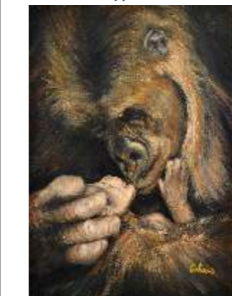
22 CULINAS BARBARA - Pristine