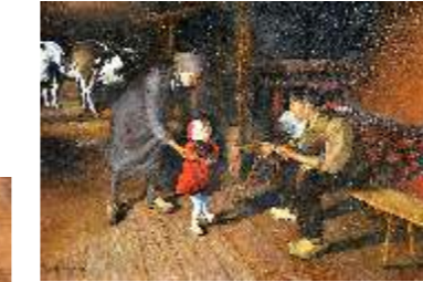
62 SCHIAVON RENATO - Gli ultimi