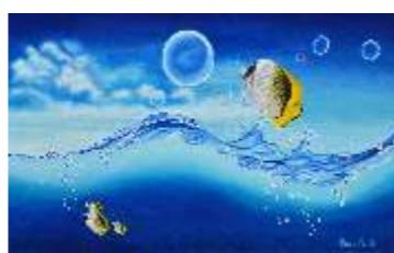
15 CASALI ALESSIA - Tra cielo e mare