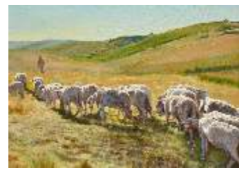
3 ANELLO MAURO - Sogno nel Belice