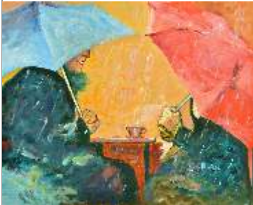
46 MUSIZZA DILVA - Chiacchiere