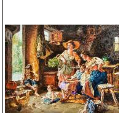
41 MAROTTOLI IDA - Ai vecchi tempi