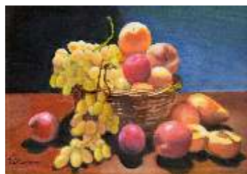
13 BRANCACCIO FRANCESCO Cesto di frutta