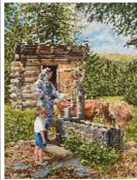
75 ZONTA MITJA Scenetta di montagna