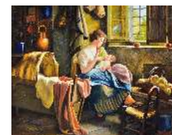
40 MAIOLA CLAUDIO - Amore di mamma