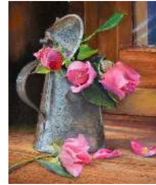
72 VIVODA SERENA - Rosa, rosae...