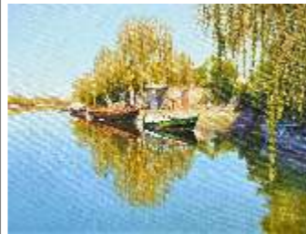
69 STUPER MARINELLA - Riflessi