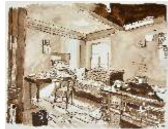
4 BANDA PIERGIACOMO Interno rustico