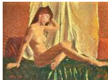
51 POLLI DIEGO - Modella