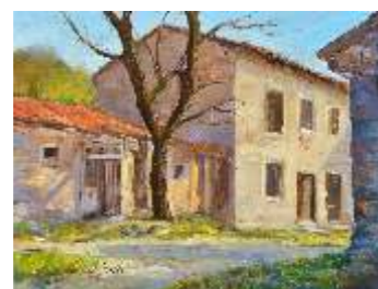
5 BELLE ADRIANA - Angolino carsico